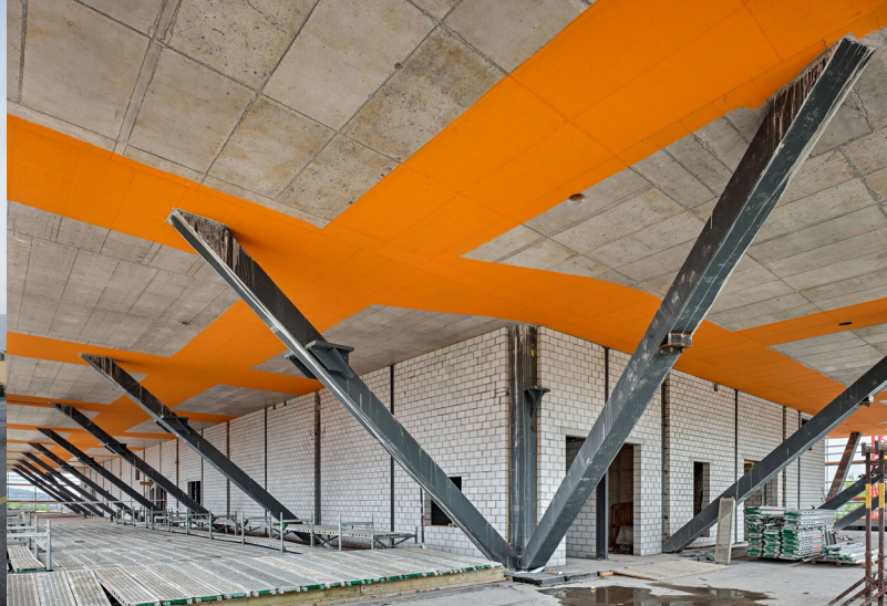
Kantonsspital Frauenfeld, 2021