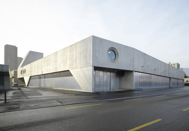
VBZ Busgarage, ERZ Werkhof, Zürich, 2020